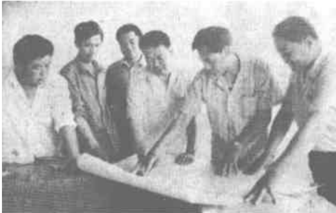
乡领导在研究工业开发区发展规划。

随着改革开放的不断深入，油郭乡借助良好的各种有利条件，大力发展乡村企业。到目前，全乡乡村企业已发展到16个，今年，计划产值4200万元，实现利税750万元。