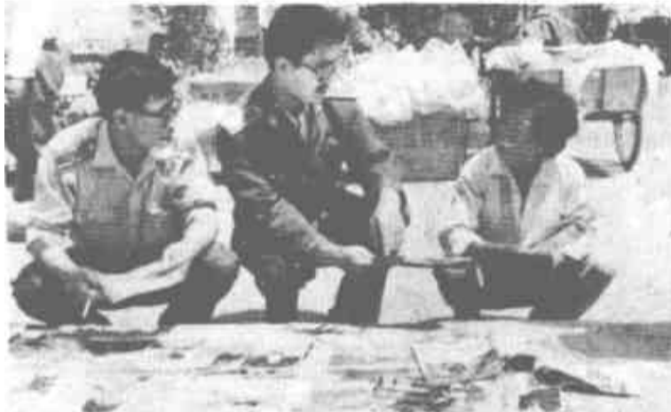
东营区工商局胜利工商所把文化市场管理列入重要工作日程,经常到书摊进行检查,净化文化市场,取得了较好社会效益。图为市场管理人员在检查书摊。

近几年,他们还把近百名青年干部选派到乡镇和企业挂职。对表现突出和工作能力强的干部,大胆使用,让青年人在风浪尖接受考验。目前,全县35岁以下的副科级以上干部已达180多人,其中正职31人。(巴增举)