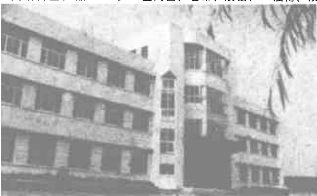
图为油郭乡新近落成的乡政府办公大楼。

目前，产品除满足本市需求外，还销往淄博、滨州、河口、齐鲁石化等地区。由该厂提供成品材料的市人民商场火灾后重整修工程、胜利集团公司装饰工程均受到好评。