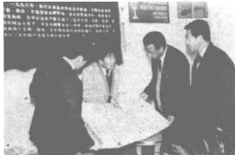
镇领导班子正在研究建设规划